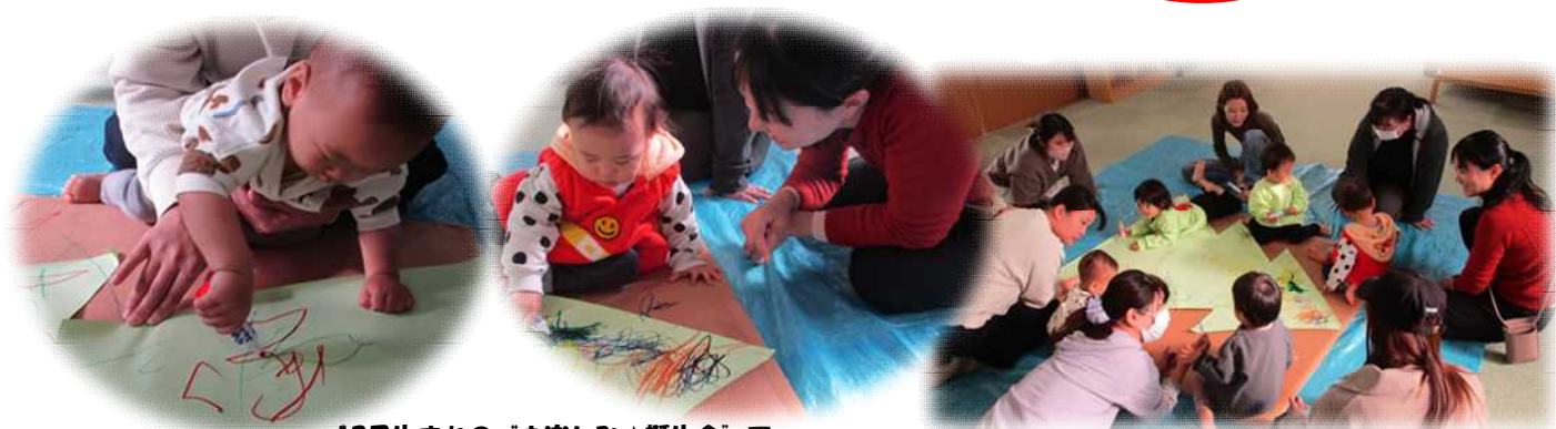
12月生まれの「お楽しみ」誕生会 でお絵描きをしたよ