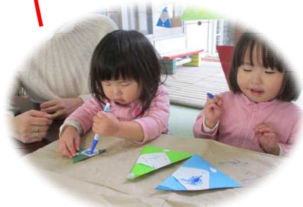
久御山町シニアクラブ連合会の方から 頂いたサンタさんに顔を描いたよ