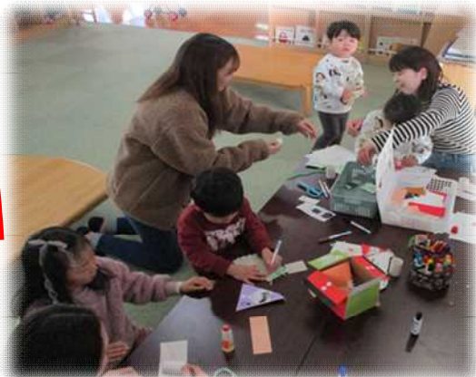
こども園帰りのお友達も 製作を楽しんだよ