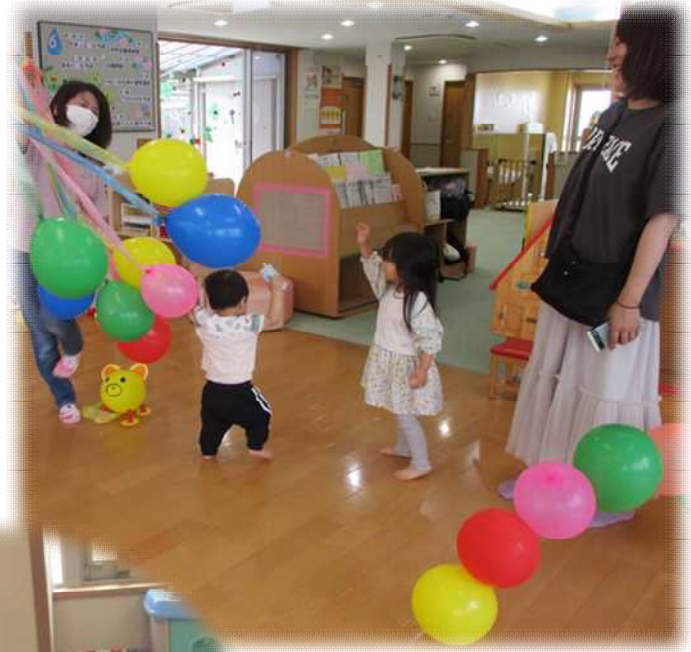
風船の下をくぐるよ~!