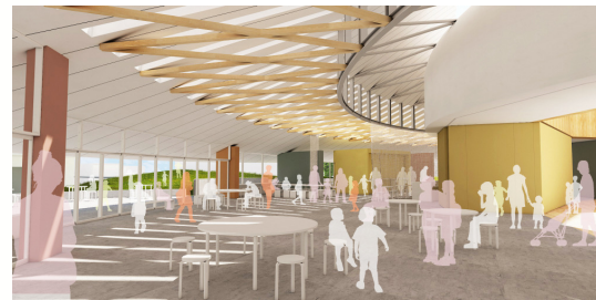
全世代・全員活躍まちづくりセンターイメージ