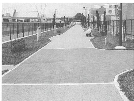
▲栄緑の回廊（国道24号方向）

栄緑の回廊は、宇治市側とあわせ、 総延長は725m（久御山町側408 m、宇治市側317m）、幅10mの直 線に見通しが良い歩行者専用通路に なっています。 通路両側には、さくら・さくらが ムクゲ・アラカシを中心とした、中 高木や低木の樹木が約1,300本植 栽されています。