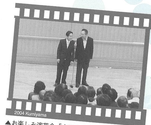
2004 Kumiya ▲お楽しみ演芸会「中田カウス・ボタン」 (5月5日・ゆうホール)