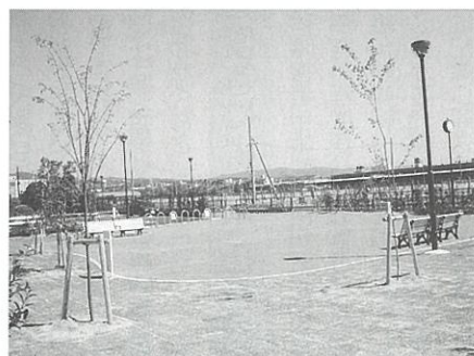
▲栄みどり公園（公園の北西角から）

一方、栄みどり公園は、面積が約1, 000平方mあり、レンガ舗装と芝生 張り、回廊と一体となった公園です。 園内には、時計やベンチ、水のみ場 が設置され、回廊の憩いの空間として の機能を備えた明るく見通しが良い公 園になっています。 この回廊と公園は、日産車体跡地の 開発により、町へ帰属されたものです。 問い合わせ：都市計画課