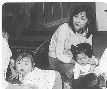
▲親子が楽しく交流

親子サロンは、初めてサロン活動に参加する人や経験のある人などが、お互いに子育ての情報を交換しながら、和やかな雰囲気の中で楽しいひとときを過ごすことができます。毎週月・水曜日の午前10時半から正午まで開いていますので、お気軽にお越しください。