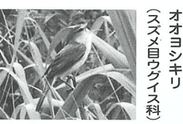
オオヨシキリ (スズメ目ウグイス科)