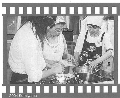
2004 Kumiya ▲季節の料理教室 (5月11日・中央公民館)