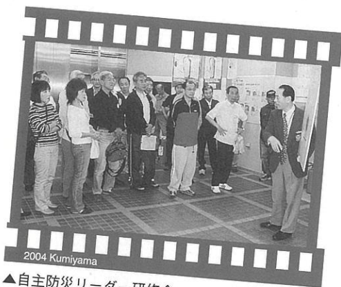
2004 Kumiya ▲自主防災リーダー研修会 (5月15日・京都市市民防災センター)