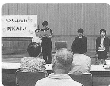
▲明快な口調で朗読

活動の集大成となる朗読の集いでは、声の広報の利用者を招き、早口言葉を交えた掛け合い「うしろ売り」や小説、詩、エッセイ、川柳などを朗読。軽妙な掛け合いの朗読劇も行われ、参加した人たちは磨きぬかれた言葉の世界を楽しんでいました。