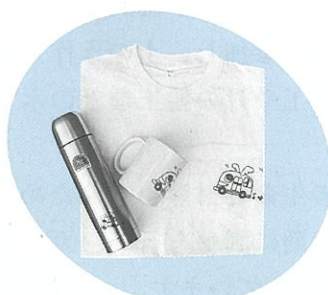
▲オリジナルグッズ

1日乗車券には、のってこバスのオリジ ナルグッズが当たるスクラッチくじがつい ています。スクラッチくじを削って当たり が出たときは、のってこバスのシンボルマ ーク入りマグカップや水筒などの、オリジナ ルグッズをプレゼントしますので、1日乗 車券を都市計画課までお持ちください。 問い合わせ：都市計画課