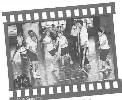
2004 Kumiya ▲京都パープルサンガサッカー教室 (5月10日・東角小学校)