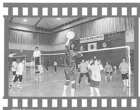
2004 Kumiya ▲第15回ソフトバレーボール大会 (5月9日・総合体育館)