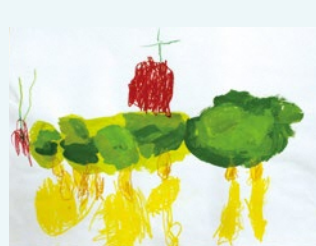
4歳児 竹本 日向 (栄) 評 元気なあおむしが、苺を見つけて嬉しそうですね。どこに行くのかな？