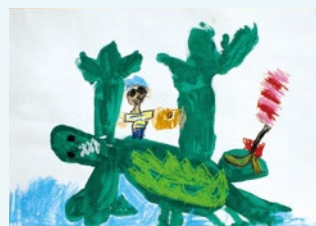
5歳児 岡本 樹 (林) 評 エルマーが大きなワニののって川を渡る姿がダイナミックですね。