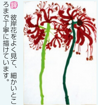
5歳児 奥村 雪菜 (栄) 評 彼岸花をよく見て、細かいところまで丁寧に描けています。