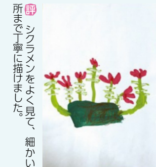
5歳児 吉川 輝 (坊之池) 評 シクラメンをよく見て、細かい所まで丁寧に描けました。