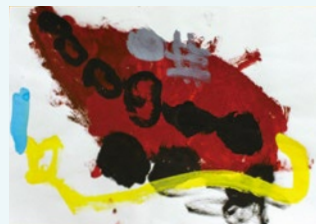
4歳児 北村 風樹 (栄) 評 大きな消防車が描けました。今にも走り出しそうですね。