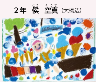
2年 候 空真 (大橋辺) 評 絵本の楽しそうな雰囲気をクレパスと絵の具で上手に表現できました。