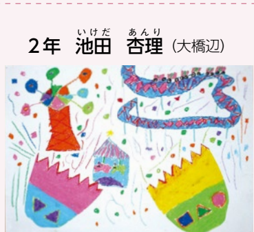
2年 池田 杏理 (大橋辺) 評 カラフルな色使いで遊園地の楽しそうな雰囲気をよく表現しています。