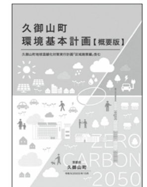
▲基本計画の概要版を全戸配布します

環境と経済の両立をめざした計画 久御山町の緑豊かな自然や環境を守り、将来の世代に継承していくための各種施策や取り組み、地球温暖化対策のための温室効果ガスの削減目標と施策を設定しています。 また、地域の絆を育み、住民・事業者・関係団体・行政などがともに協働・連携して取り組む、環境と経済の両立をめざした計画となっています。 久御山町における温室効果ガスの削減目標を定めた「地球温暖化対策実行計画「区域施策編」」及び気候変動に対応するための「地域気候変動適応計画」もあわせた一体の計画です。