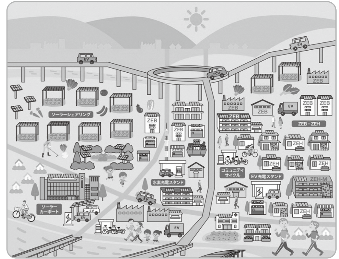
▲将来像のイメージ図

豊かな 自然 と 活力ある産業 が共生する 環境都市 くみやま ～地域の絆を育み、恵まれた環境を将来の世代に継承する～