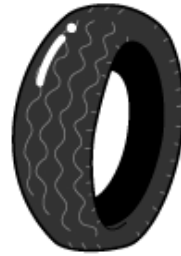
タイヤ(車・バイク)