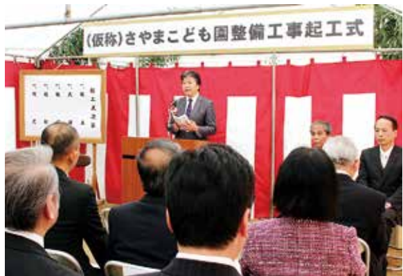
▶起工式で式辞を述べる信貴町長

起工式では信貴町長が「現在、久御山学園として、地域と保育所・幼稚園、小・中学校が一体となつて久御山町の子どもたちを育てているところです。本施設の整備により、さらに就学前教育の充実が図れるものと期待しています」と式辞を述べました。