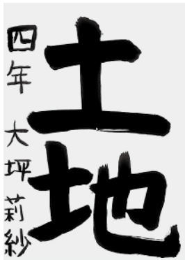
4年 大坪 莉紗 (市田)