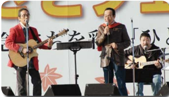
▲観客を魅了したビリーバンバン

ふるさとフェア久御山が、まちを彩る「ひと・もの・しぜん」をテーマに11月23日、中央公園で開催され、雨上がりのおすがすがしい秋空のもと町内外から約18,000人が訪れ、まちの産業にふれあいました。