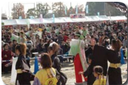
▲観客と一体となったよさこい音頭

会場では、商業・工業・農業・一般・特設の各エリアで特色ある催しを実施。町制施行55周年を記念して設けられた特設エリアでは、山城地域の特産品の宇治茶や柿・新鮮野菜などを販売。商業・工業エリアでは、町内企業の製品の展示販売、農業エリアでは、採りたての農産物などが販売され、買い求める人たちで会場は大いににぎわいました。