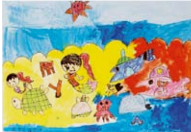
2年 上角 萌花 (市田)

評 お姫様やさかな・たこ・かもめが出てくるすてきな夢を明るく、楽しい絵に表現できました。