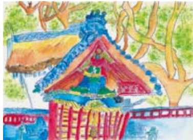
3年 山本 麗斗 (下津屋)