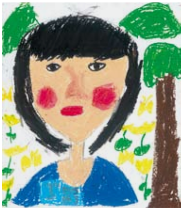
3年 大住 凧 (東一口)