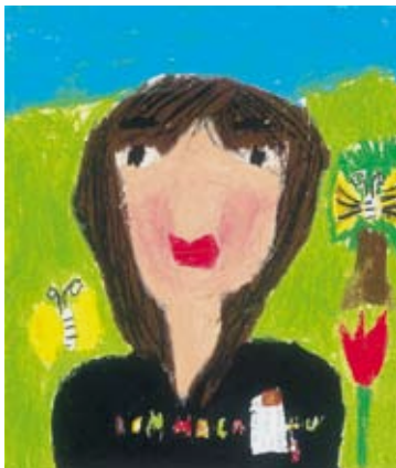
3年 菅沼 七海 (藤和田)