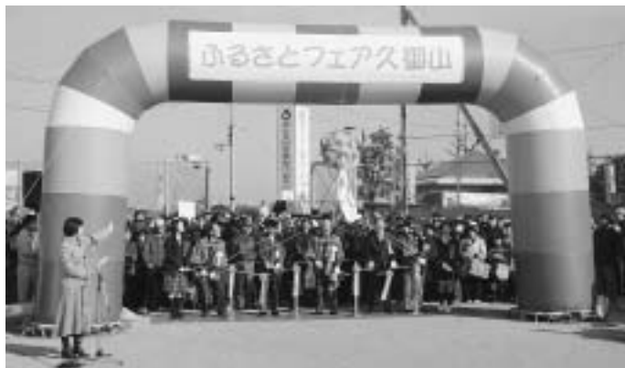
▲テープカットとくす玉割りでオープニング