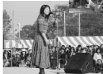
◀石川ひとみコンサート