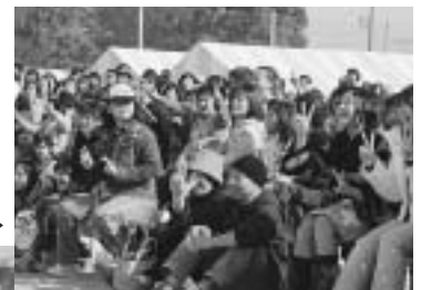
▶漫才を楽しむ人たち