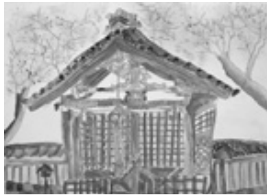
6年 戸島 洋子 (佐山)