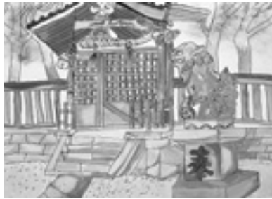
6年 村山 稜 (林)