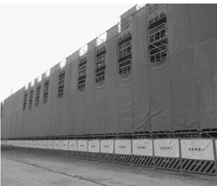
工事は12月末～来年9月末の予定 ※FST工法 P7参照