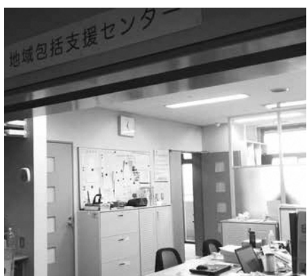
地域包括支援センター

そこで、中心的役割を果たす地域包括支援センターの充実策の方針について定めていく。