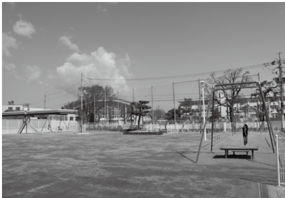
佐山保育所跡地にできた内屋敷公園