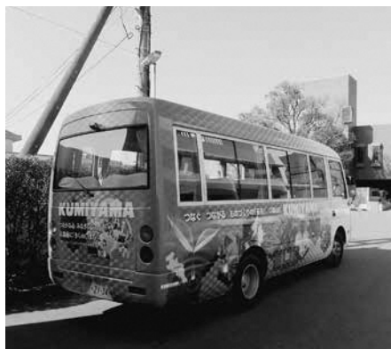
テスト運行に利用予定の町バス