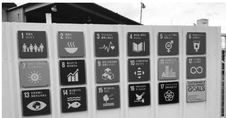
町内事業所の壁に描かれた17の目標

内閣府が設置している地方創生SDGs官民連携プラットフォームに参加したところであるが、今後町内プロジェクトチームを組織して、推進し取り組んでいく。