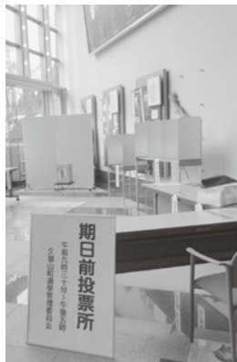
ゆうホールの期日前投票所