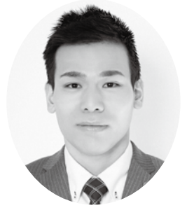
芦田 祐介 議員