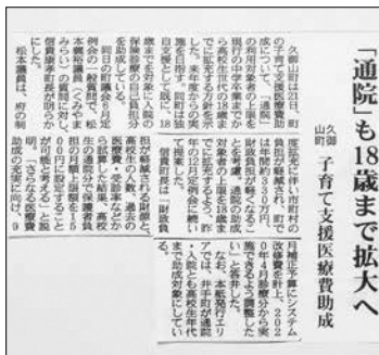
6月22日付洛タイ新報

保護者が負担する月額の自己負担上限額を1500円に設定することが可能ではないかと考え、令和2年4月診療分から実施できるように、議会とも調整する。