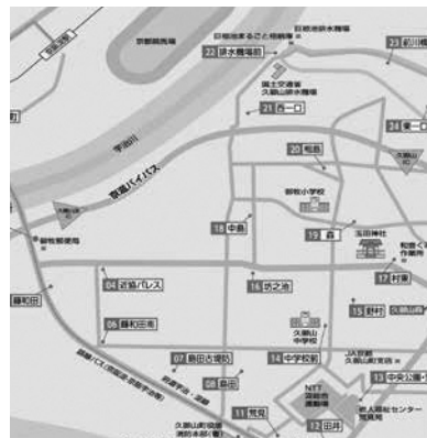
のってこタクシー停留所

バス事業者が当初見込んでいた 人数より少ない状況であるが、バ ス事業者からはこの路線について は長いスパンで状況を見守ってほ しいと聞いている。