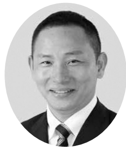
田口 浩嗣 議員