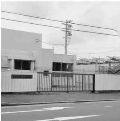
久御山町浄水場（佐古外屋敷）