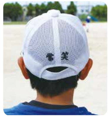
選手の帽子には『常笑』の二字

「今回のチームは、体格で平均より小さく、好投手やスラッガーのいない、守りのチーム」と分析するのは田口監督。このチームにかける監督は、学童野球の基本である楽しくやる想いを、『常笑』（じょうしょう）の文字に託して勝ち上がり、その笑顔で、8月18日、明治神宮野球場へむかいます。選手たちは、「久御山の花を咲かせる」と、誓ってくれました。