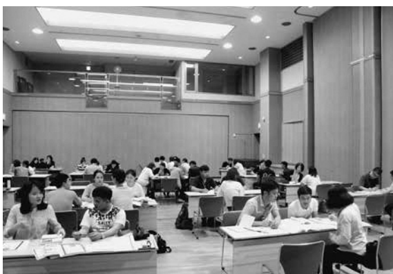
日本語教室の様子

ハザードマップは、府国際センター作成ものを活用し、昨年11月に更新した。 ごみのガイドは8月に提供予定。