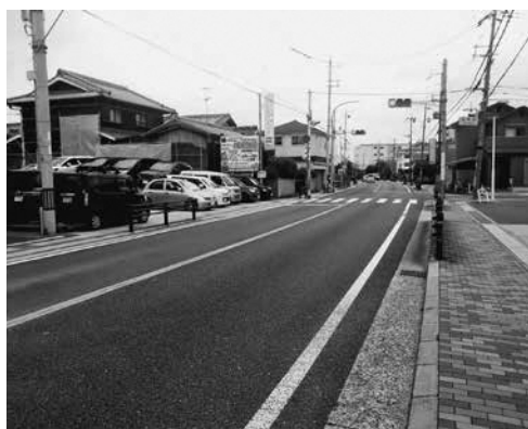
振動問題が大きい藤和田地域

振動測定は継続して実施し、経年検証していき、必要であれば抜本的な対策を要求する。