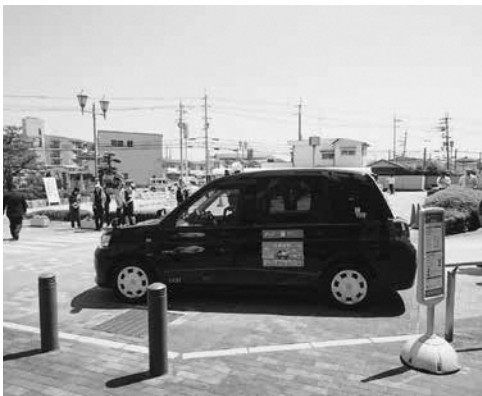
のってこ優タクシー出発式

更新ごとに登録をやり直すことは、住民にも大変負担をかける。簡素化に向け積極的に検討する。