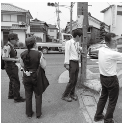
危険箇所の実地点検 (6月6日)

危険箇所の点検結果を踏まえ、歩道に防護柵などの交通安全施設が有効であると判断する箇所は、今後、計画的に設置を図っていく。