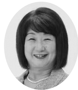
戸川 和子 議員