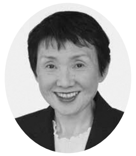
巽 悦子 議員