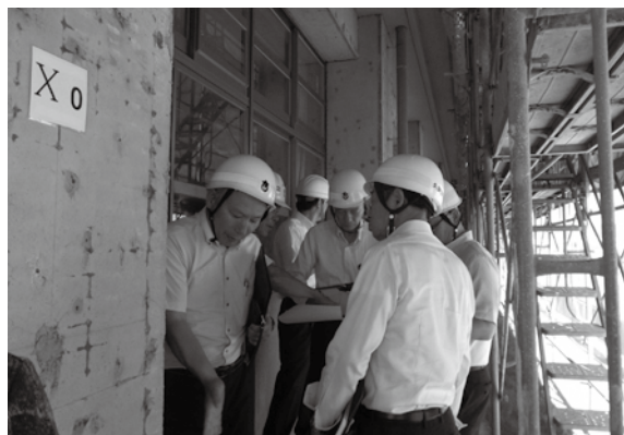
中学校校舎の外壁工事箇所を視察 (6 / 25)

Q 長期間シートで囲まれた学校は、周りから見れば異様な状況である。この環境を町としてどのように考えているのか。 A 安心安全の面から考えると、きつちりとした施工が必要。できる限り環境は整えている。改良を重ねていきたい。