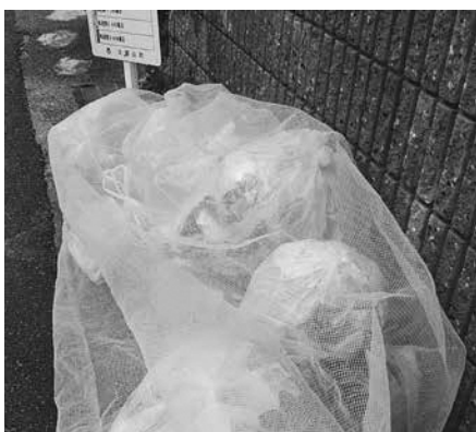
カラス対策の黄色いネット