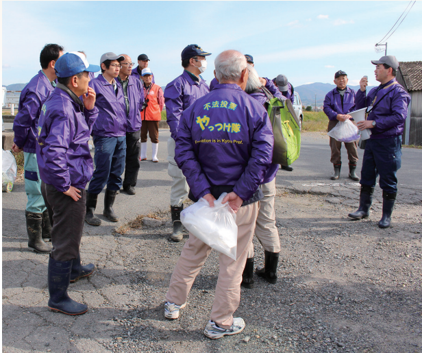
▲不法投棄の撤去活動に集まった「やっつけ隊」