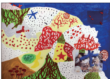
5年 堀江 悠煌 (東一口)