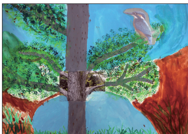
5年 三輪 観悟 (野村)