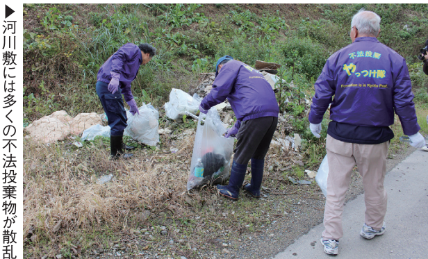
▶河川敷には多くの不法投棄物が散乱