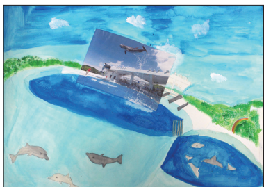
5年 打越 友梨 (相島)