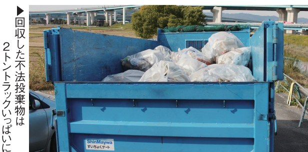
▶回収した不法投棄物は2トントラックいっぱい

の活動で、この日は、古川を美しくする会のメンバーやボランティア、京都府産業廃棄物協会、府、町の職員など25人が参加。3班に分かれて