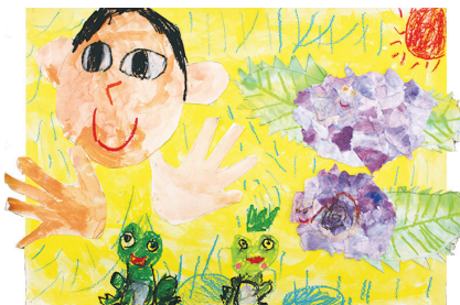
2年 大西 颯斗(栄)