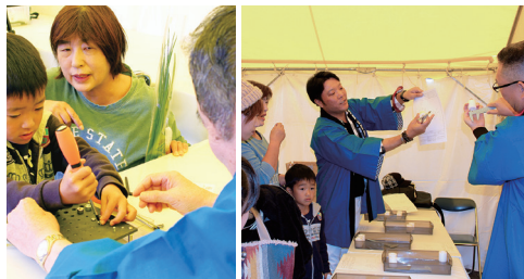
▲昨年の町民文化祭と商工会フェスタ