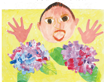
2年 廣瀬 晃輝(林)