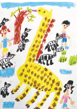
1年 辻 祐奈(栄)