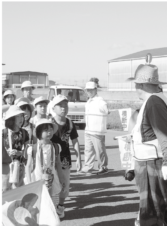
見守り隊の皆さんが誘導する中を登校する児童

交通弱者である子どもの交通事故は、歩いているときや自転車に乗っているときに多く発生しています。グラフ①は宇治警察署管内の今年上半年の高校生以下の交通事故の状況です。歩行中あるいは自転車乗車中の事故が目立っています。特に道路横断中の事故では横断歩道以外の場所での横断中に事故