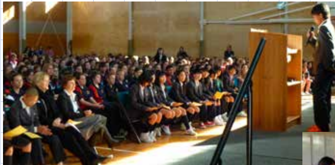
▲歓迎会で英語で自己紹介する久御山中の生徒