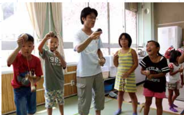
▲京都大学けん玉クラブの学生(中央)から、けん玉を教えられる