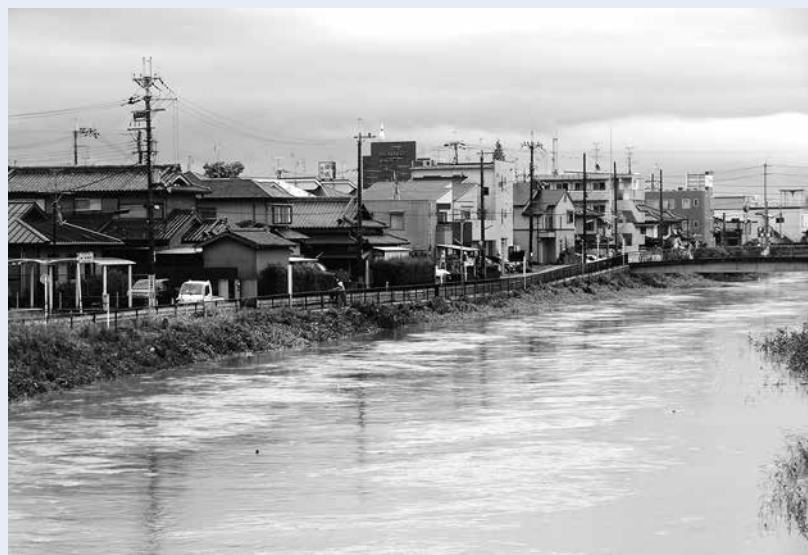
集中豪雨で増水する古川（平成24年8月）

▽非常食（そのまま食べられるが、簡単な調理で食べられるもの。しょう油や味噌などの調味料も準備しておくと便利） ▽水（飲料水は1人1日3リットルと生活用水） ▽生活用品（カセットコンロとガスボンベ・毛布・衣類・トイレットペーパー・生理用品など）