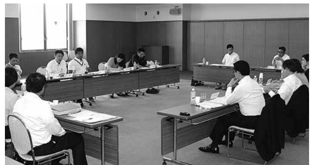
6月13日に開かれた総合戦略会議。町の課題などを議論