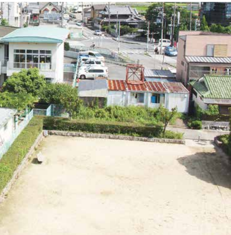
▲こども園として整備される佐山幼稚園(左)と内屋敷公園(右)