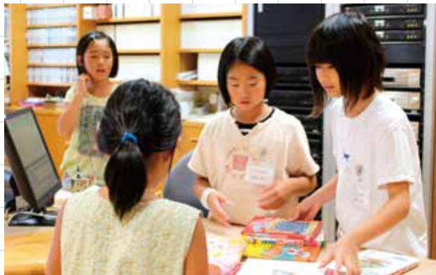
▲図書の貸出や返却などを体験する「子ども一日図書館員」

図書館の仕事を知ってもらい、本を身近に感じてもらえたらと、実施したもので、図書館職員から館内の案内や業務の進め方などの説明を受けた後、カウンター内での貸出・返却や、図書の配架・整頓、装備などをテキパキとこなしていました。参加した児童は「本が好きなので、一度体験してみたかった。楽しいです」と話してくれました。