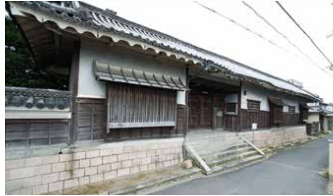
東一口の山田家住宅。屋根の葺き替えや長塀などの保存・修理工事に着手

●平成26年度各会計の収支見込み 一般会計歳入歳出差引額は2億3,458万円 平成26年度の一般会計や特別会計、水道事業会計の3月末現在における収入・支出状況と決算見込額などの財政状況をまとめました(金額は、いずれも1万円未満四捨五入)。 平成26年度一般会計の歳入歳出予算額(平成27年3月末)は、67億152万円です。このうち、3月末現在の収入済額は65億4,219万円、