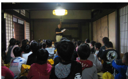
主屋内での「ふるさと教室」の様子