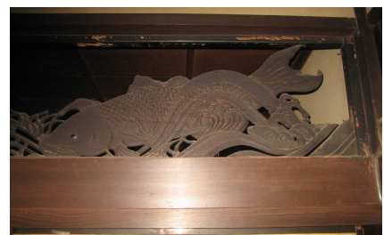
鯉を形どった欄間