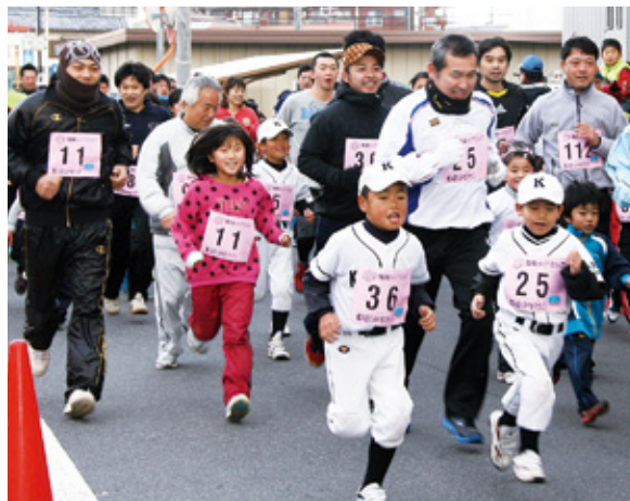
▲親子仲良く走りました ▲