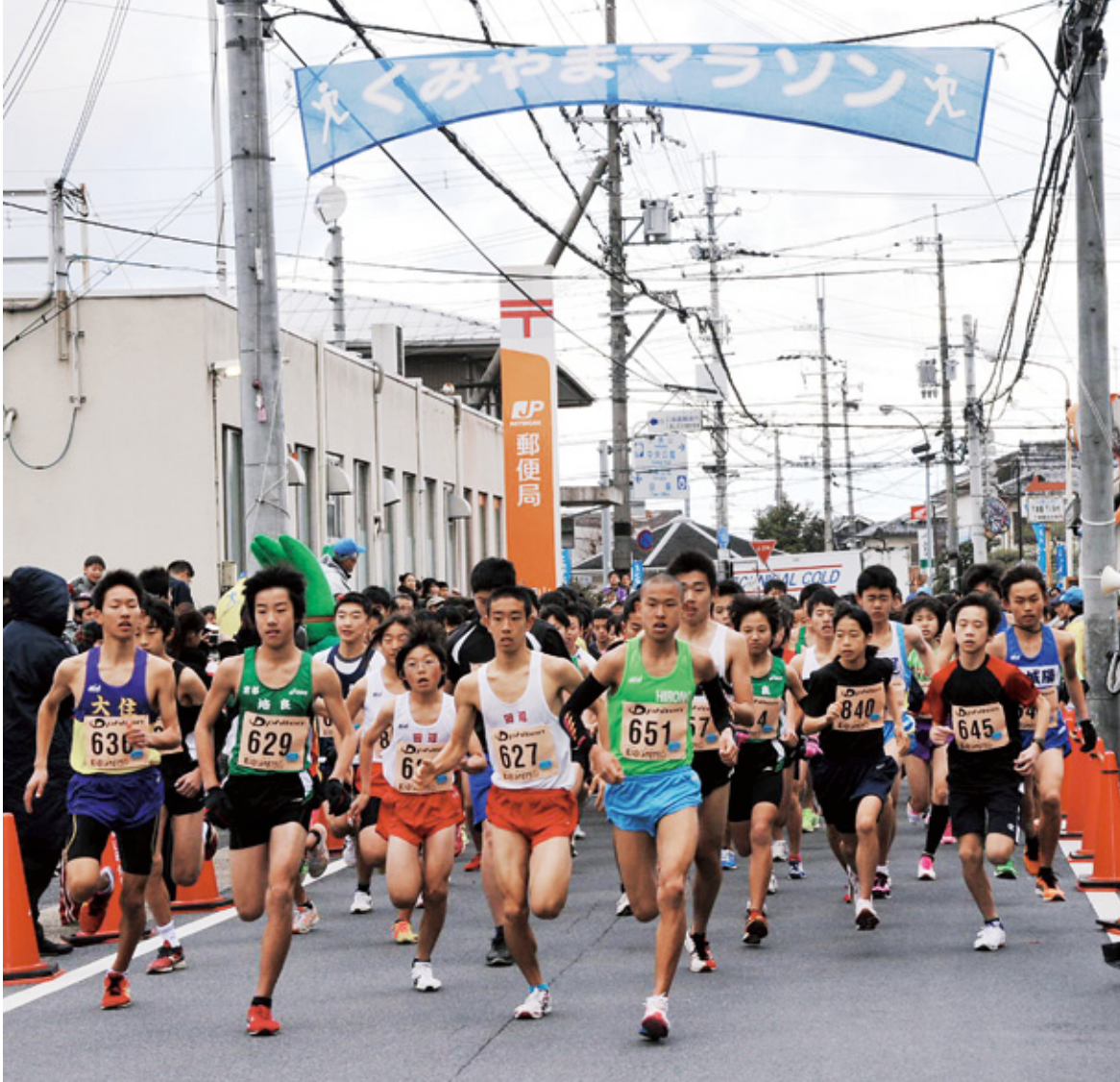
▲号砲とともに勢いよくスタート(3*部の部)