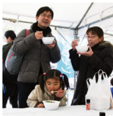
▲豚汁で心も体もホッカホカ