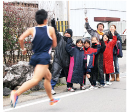
▲沿道の応援を受けて走り抜けるランナー