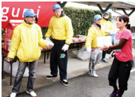
◀走り終えたランナーに水分を