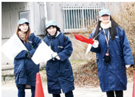
◀走路誘導と元気な応援