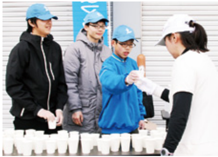
◀中学生もボランティアで参加