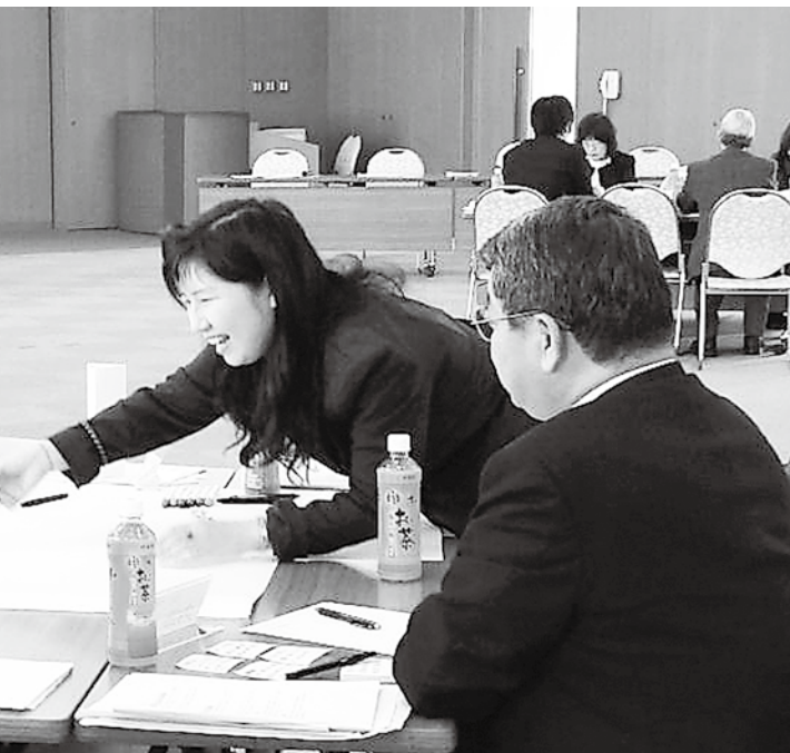
終始熱心に討議が繰り広げられました

まず、「久御山町の好きなところ、嫌いなところ」について自由に意見を出し合い、昼食を挟んで午後から、▽住民ができる久御山町の魅力アップ大