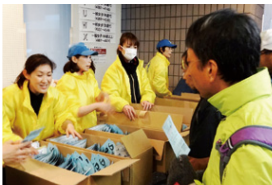
▲受付では笑顔でお出迎え