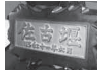
佐古堰のプレート (佐古自治会蔵)