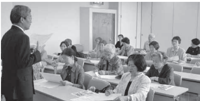
▲真剣に歴史を学ぶ参加者

今回は、地元の歴史を子どもや孫と家庭などで話題にできるように、小学校の副教材で教えている内容を勉強しました。参加者は、第2京阪道路建設工事に伴う発掘作業で古代出雲歴史博物館に貸し出された珍しい くだたま 管玉の発掘事例などを学び、歴史のすごさに驚いていました。