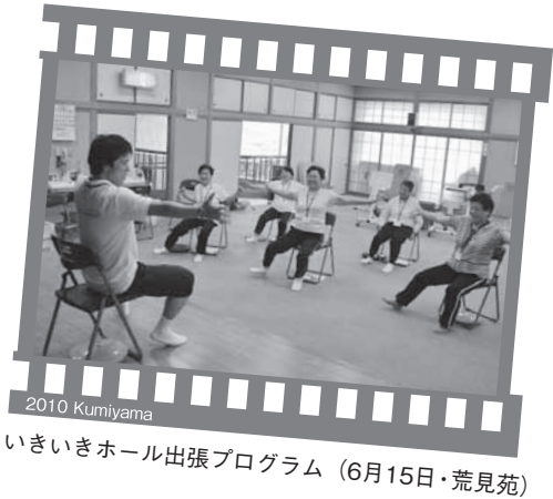
2010 KumiYama いきいきホール出張プログラム (6月15日・荒見苑)