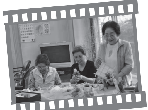
2010 KumiYama エコクラフト教室 (6月3日・荒見苑)