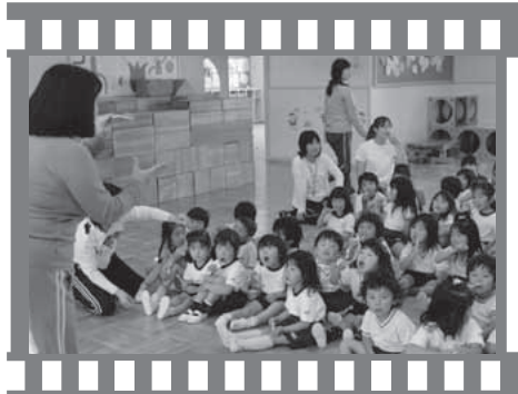
2010 KumiYama 歯みがき指導 (6月4日・佐山幼稚園)