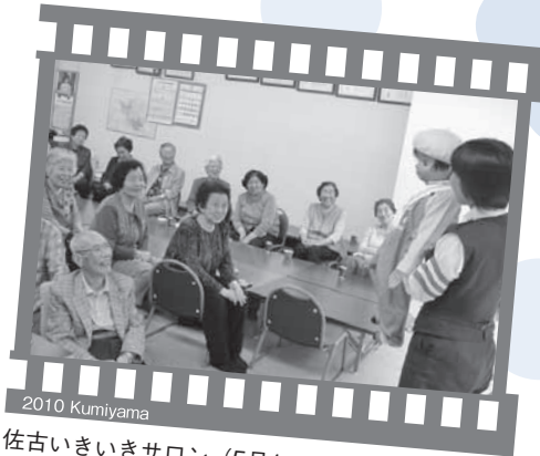
2010 KumiYama 佐古いきいきサロン (5月17日・佐古公民館)