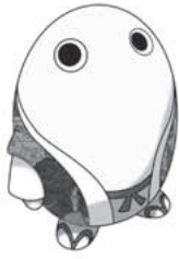
第26回国民文化祭 PR隊長「まゆまる」

国内最大の文化イベントである「国民文化祭」は、全国各地でおこなわれている様々な文化活動を全国的な規模で発表・鑑賞・交流する祭典で、毎年47都道府県でリレー開催されています。