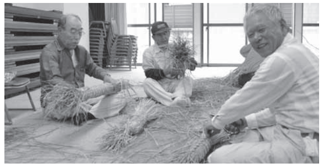
▲神前に供えるチマキ作り

また、前日には、佐古公民館で宮総代や自治会の役員の皆さんによって神前に供えるチマキ作りがおこなわれ、真 菰の香りが匂う直径10㍍、長さ60㍍の特大のチマキが作られました。