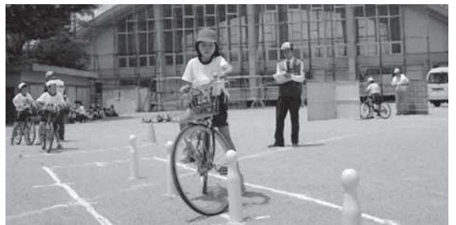
▲うまくコーンの間を走る児童

児童たちは、信号で左右の安全確認をして渡るなどの法規走行コースを走ったあと、技術走行コースのジグザグコースでは「あ・あ」などの声を漏らしながら走行、ゴールまで来ると「ヤッター」と歓声をあげていました。