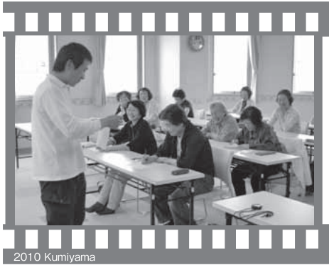
2010 KumiYama 脳若返りプロジェクト (5月20日・ゆうホール)