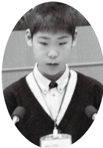
御牧小学校 中村 泰雅 議員

質問 電車の駅を町内につくってもらえませんか。バスは、本数も少ないため不便で、出かける時は、父や母に駅まで送ってもらっています。地球温暖化ストップにも貢献できると思っています。