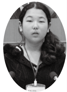
東角小学校 河本 絵理奈 議員