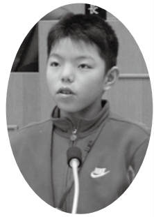
東角小学校 田村 哲哉 議員