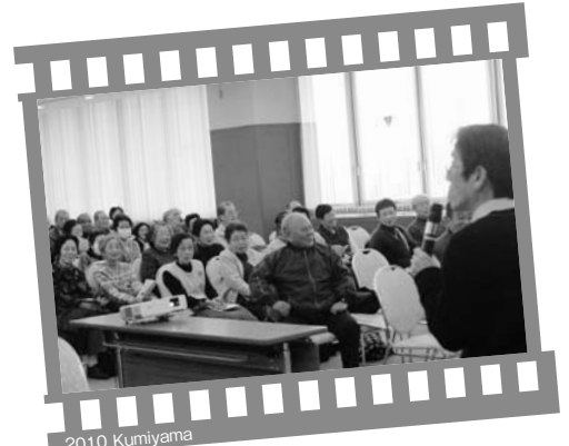
2010 Kumiyama いきがい大学 (1月25日・役場5階コンベンションホール)