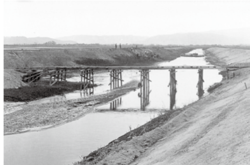
▲古川改修工事現場の木橋

したがってこの幹線道路から離れている集落の人々は、新橋へ行くのに随分不便な思いをしたに違いない。例えば市田の人が小倉村(現宇治市)へ行くとなると、現在では安田橋を渡れば近い距離である。しかし明治中期には安田橋はなく、対岸に安田村(現宇治市)