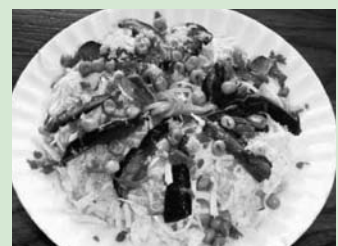
「くみやま食暦」作成検討会