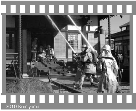
2010 KumiYama 文化財防火訓練 (1月24日・光福寺(市田))