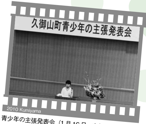
2010 KumiYama 青少年の主張発表会 (1月16日・ゆうホール)