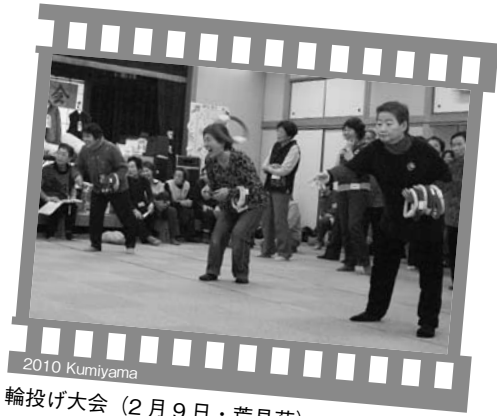
2010 Kumiyama 輪投げ大会 (2月9日・荒見苑)