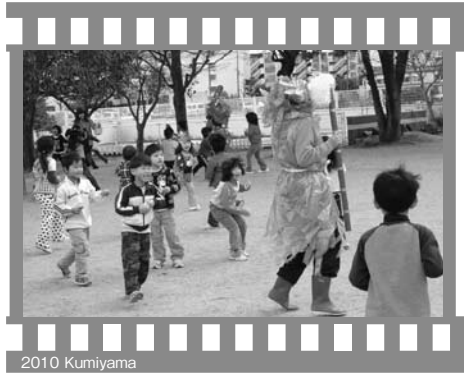
2010 Kumiyama 豆まき (2月3日・東角幼稚園)