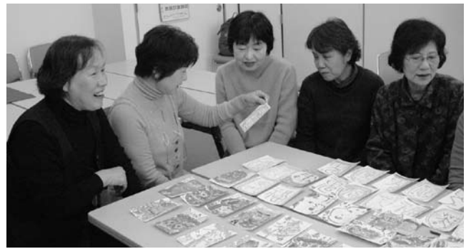
▲絵手紙を発送する準備をする会員

1月22日に絵手紙サークル和のみなさんが、「絵手紙の日」のために書いた節分にちなんだ絵手紙約30通を持ち寄り、発送準備をしました。会員の皆さんは、「絵手紙は、心のこもったオリジナル作品。書いた時の感動が受け取った人に伝わればうれしい。豆まきのように皆さんに届けたいですね」と話しておられました。