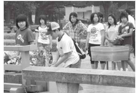
慰霊碑に献花して、めい福を祈る参加者

をして、原爆で亡くなられた人々のめい福を祈りました。その後、広島平和記念資料館で当時の写真や遺品などを見学した団員は、戦争の悲惨さや原子爆弾の恐ろしさを目の当たりにして、あらためて平和の尊さを学ぶとともに二度と戦争を起こしてはならないと心に誓いました。