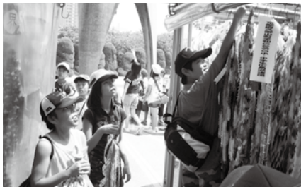
原爆の子の像に千羽鶴を捧げる参加者

町では毎年、小・中学生に戦争の悲惨さ、核兵器の恐ろしさ、平和の尊さを学んでもらうため広島派遣をおこなっています。今年は47人の