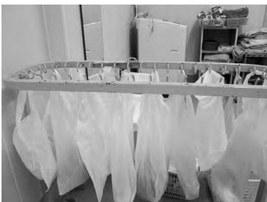
現在のおむつの管理状況

園内の環境設備、収集業者の選定、保護者への周知もあるため、令和6年度からのおむつの園内処理実施に向けて準備していく。