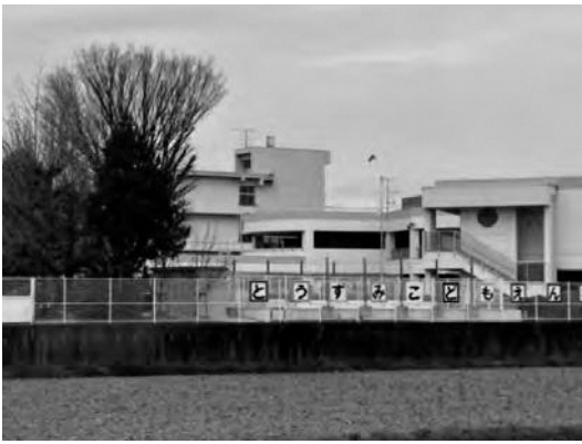
保育料の完全無償化に期待したい

子ども・子育て支援プランの改定をするための基礎調査の中で、子育て中の家庭だけでなく、今後を担う若い世代など幅広い世代の意見やニーズを把握し、国の動向を踏まえ、子育て支援策について、しっかりと見極めたい。