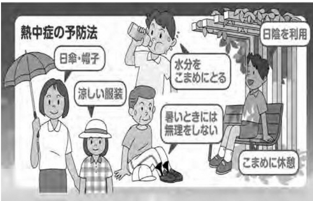
熱中症の予防方法（環境省リーフレットより）

今後、地球温暖化が進行すれば、本町においても熱中症による被害がさらに拡大するおそれがあるの