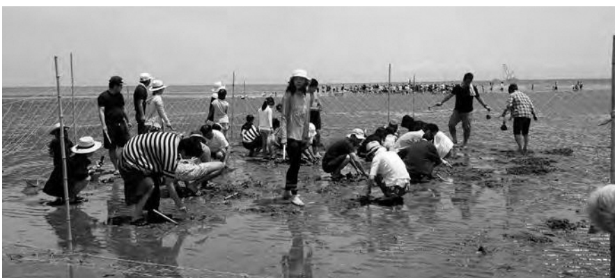
自治会のレクリエーション（潮干狩り）

各自治会や団体においても、地域の賑わいを取り戻そうと積極的に活動しようとしていられるところが数多くあり、この事業の手応えを実感している。その皆さまの活動を大変ありがたく感じている。今後とも、住民と一緒に、地域の絆、人と人との絆、地域で子育てを推進する絆を再構築したい。