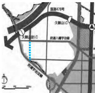
平成28年まで府へ要望していた構想道路

振動問題は本当に深刻に受け止めており、振動調査のデータを基に現状把握し、府に振動の原因を改めて究明していくことが必要と調査の実施を強く求めていく。