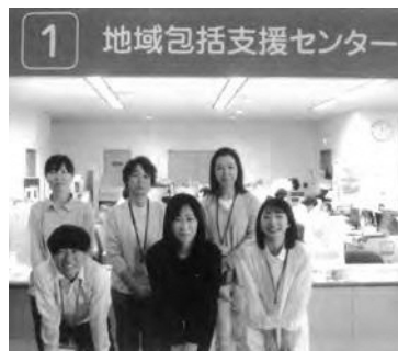
久御山町直営の地域包括支援センター

久御山町直営の地域包括支援センターによる在宅介護の状況は担当するケアマネジャーが把握している。本町では、地域包括支援センターを昨年直営化し、ケアマネジャーと連携し、即時に実態把握ができるようにしている。