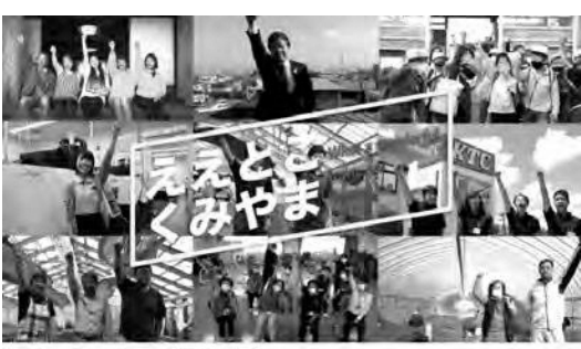
久御山町プロモーション動画 (PR動画) 久御山町役場久御山町チャンネル登録者135人

議員からのこういう質問自体が話題性を高めるものになっているとありがたく受け止めている。感性については、個人差がある。動画には、農業・工業など各分野で活躍されている多くの皆さまに出演していただいております、町の魅力を独自に発信できている。