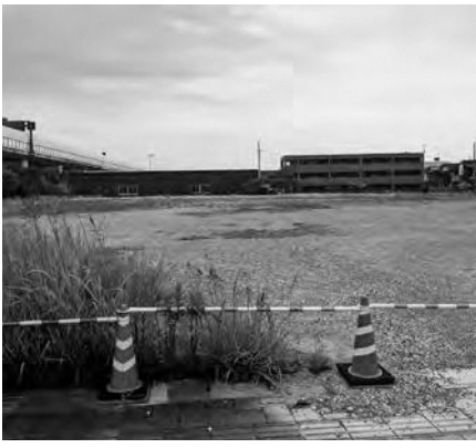
森南大内地区のホテル建設予定地