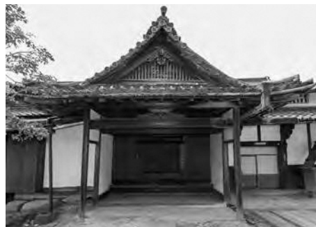
旧山田家住宅 (東一口)