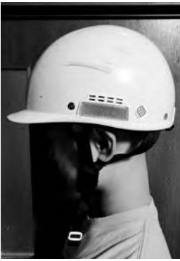
努力義務となったヘルメット