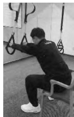
機能訓練のイメージ

一日中座っていることで、足腰が衰え歩行困難になる方もいる。本格的な機能訓練を導入する考えは。