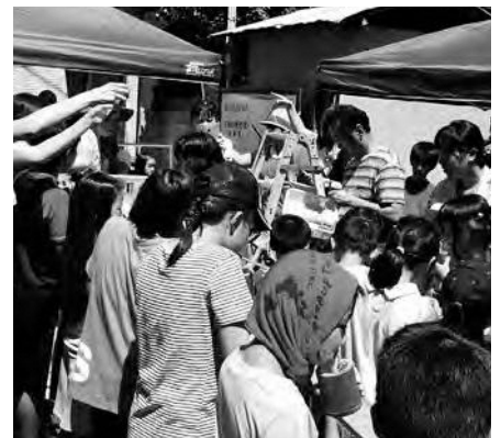
自治会の夏祭り（流しそうめん）

また、夏祭りなどの行事やレクリエーション旅行、学生と連携したイベントなどの相談を受けている。